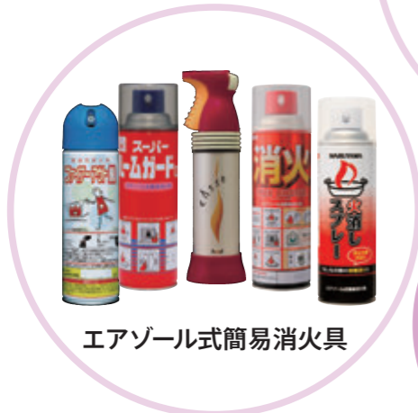
エアゾール式簡易消火具